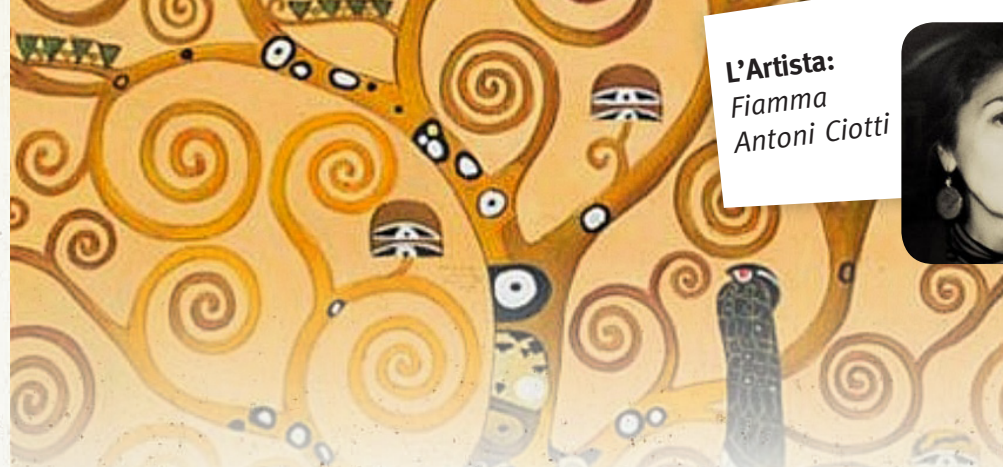
L'Artista: Fiamma Antoni Ciotti

Costo: 120 euro ogni incontro inclusi i materiali